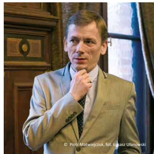
© Piotr Matwiejczuk, fot. Łukasz Ulanowski

Piotr Matwiejczuk Program 2 Polskiego Radia