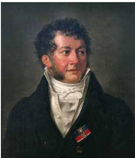
Michał Kleofas Ogiński — François-Xavier Fabre, 1805-06

należy jednak zapominać, że był także jedynym kompozytorem doby romantyzmu, piszącym balety. Dzieła tego gatunku, które wyszły spod jego ręki, zaowocowały zwiększeniem rangi sztuki baletowej oraz zainicjowały jej rozwój jako autonomicznej dziedziny twórczości. Wpływ baletów Czajkowskiego można odnaleźć u Siergieja Prokofiewa i Arama Chaczaturiana. Jego twórczość wpisuje się w nurt rosyjskiego romantyzmu, zainspirowana jest melodiami ludowymi, ale także — formami zaczerpniętymi z tradycji europejskiej. Poprzez wniesienie specyficznego rosyjskiego klimatu emocjonalnego udało mu się wzbogacić nurt romantyczny w muzyce.