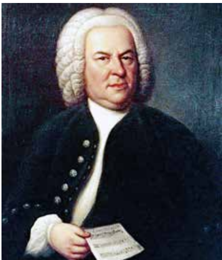
Johann Sebastian Bach — Elias Gottlob Haussmann, 1748