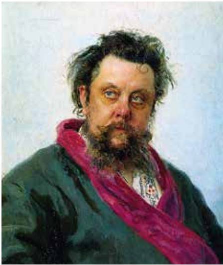
Modest Musorgski — Ilya Riepin, 1881, Galeria Trietiakowska w Moskwie

partykularyzmu narodowych cech stylistycznych. Język jej jest powszechnie zrozumiały". Okres trzeci przynosi formy wariacyjne, szerszy zakres harmonii i faktury, radykalne stosowanie kontrapunktu oraz pogłębienie intelektualnego aspektu dzieł. Życie Beethovena naznaczone było chorobą, walką ducha z ciałem. Dało zaczątek romantycznemu wizerunkowi artysty, który pokonuje przeciwności, drwiąc sobie z tego, co los mu przeznaczył. Smutne dzieciństwo, postępująca głuchota, troski rodzinne i finansowe nie zdołały ograniczyć pasji tworzenia. W odpowiedzi na nieszczęścia zsyłane przez los, Beethoven komponował kolejne dzieła, łącząc ich estetyczną wartość z postulatami etycznymi. Finał IX Symfonii stanowi przepowiednię idealnego stanu ludzkości, w którym obdarzony boskim rozumem człowiek, pokonawszy własne słabości, przewyciężywszy samego siebie, doprowadza do ucieleśnienia powszechnego stanu braterstwa. Także na poziomie bardziej przyziemnym Beethoven zachował autonomię. Jak podają źródła — zamiast być na usługach możnych, to ich podporządkowywał własnym kaprysom. Swoich protektorów traktował bezceremonialnie, a otrzymywane finansowanie odważał się kwestionować jako nazbyt niskie. „Beethoven jest pierwszym w historii muzykiem absolutnie niezależnym, który stawia czoło całemu światu”.