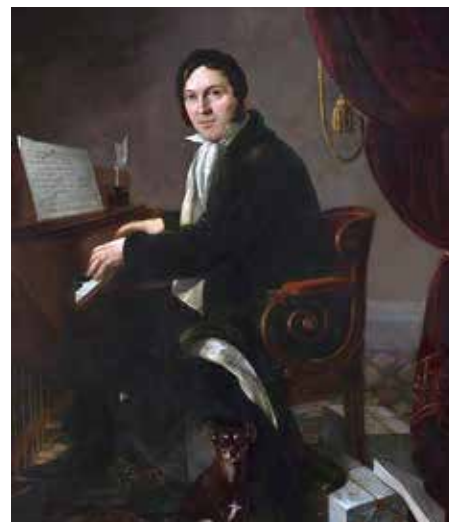
Karol Kurpiński — Aleksander Ludwik Molinari, 1825, Muzeum Narodowe w Warszawie

W swojej twórczości łączył klasyczne środki formalne — inspirując się Haydnem i Mozartem — z elementami polskiego folkloru (melodiami ludowymi i tańcami), co typowe było dla kompozytorów przełomu klasycyzmu i romantyzmu. Znany jest z dzieł wokalnie-instrumentalnych, głównie oper, których napisał blisko 30. Opery takie jak Zabobon, czyli Krakowiacy i Górale nadały mu status autora nurtu narodowego w muzyce. Pisał także pieśni religijne i patriotyczne ( Marsz obozowy, Mazur Chłopickiego, Warszawianka i in.). Był działaczem muzycznym o wielkich zasługach dla polskiej kultury I poł. XIX w., nastawionym na podniesienie poziomu nauczania i wykonawstwa oraz poszerzenie repertuaru polskich scen. Aktywny również w dziedzinie teorii i estetyki muzyki oraz etyki i filozofii.