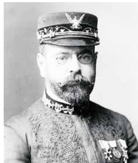
John Philip Sousa

J.P. Sousa jest najśłynniejszym twórcą marszów amerykańskich oraz uznawany jest za jednego z najważniejszych twórców tego gatunku na świecie. Jego marsze odznaczają się pięknymi melodiami i zaskakującymi harmoniami, kompozytor nie bał się nowych, niekonwencjonalnych rozwiązań.