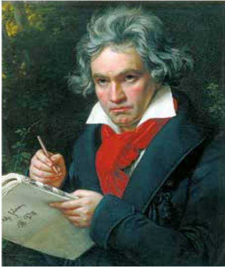
Ludwig van Beethoven — Joseph Carl Stieler, 1819–20, Beethoven-Haus, wikipedia.org (CC BY-SA)