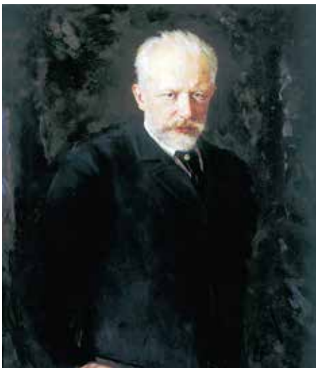
Piotr Czajkowski — Mikołaj Kuzniecowa, 1893, Galeria Trietiakowska w Moskwie