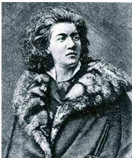
Juliusz Zarębski - b. 1885

JULIUSZ ZARĘBSKI (1854–1885) — Pianista i kompozytor, należący do XIX-wiecznej gildii kompozytorów wirtuozów, tworzący głównie muzykę salonową i wirtuozowską, na potrzeby swych licznych tournée — najbardziej znany jest zbiór Róże i ciernie . Jako dziecko uczy się gry na fortepianie pod okiem matki, a już w wieku 10 lat koncertuje w salonach rodzinnego Żytomierza. Po ukończeniu gimnazjum (z wyróżnieniem) studiuje kompozycję i grę na fortepianie w wiedeńskim konserwatorium, które kończy w ciągu dwóch lat, otrzymując dwa złote medale. Następnie studiuje w Petersburgu, by po trzech miesiącach zdać egzamin na dyplom „wolnego artysty”, oraz w Rzymie — grę na fortepianie pod kierunkiem Ferencza Liszta, który zostaje jego przyjacielem oraz opiekuje się