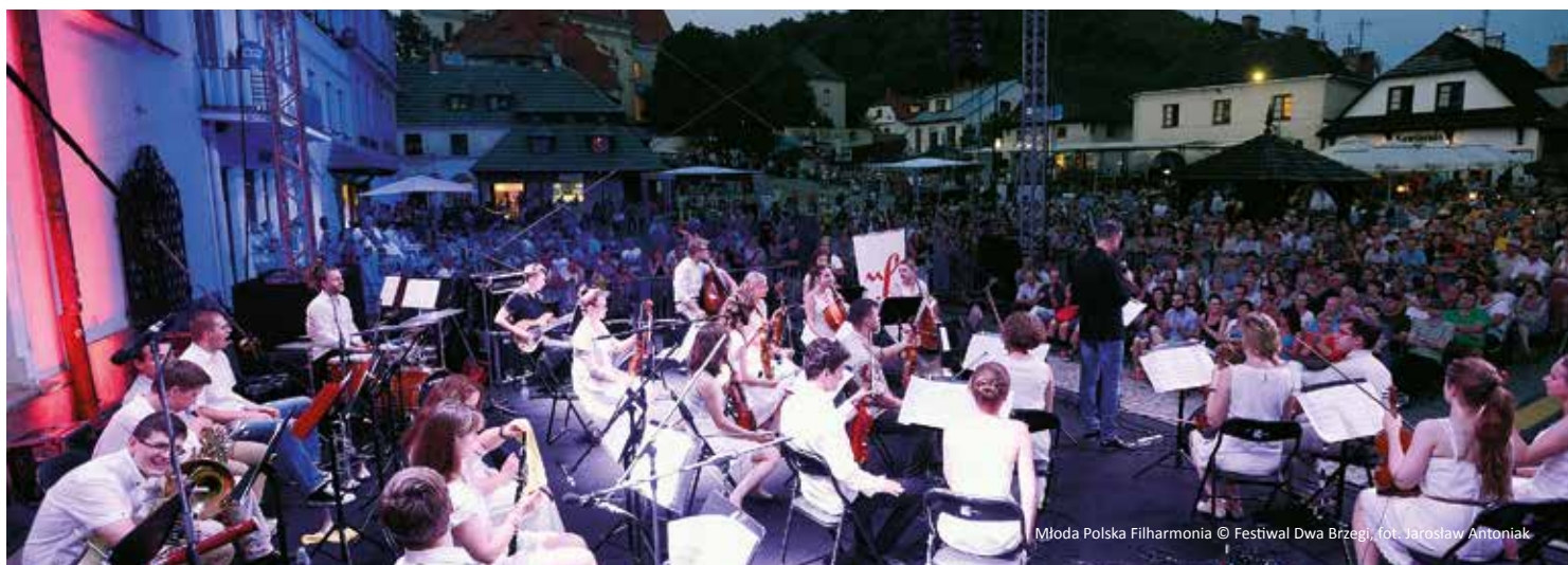
Młoda Polska Filharmonia