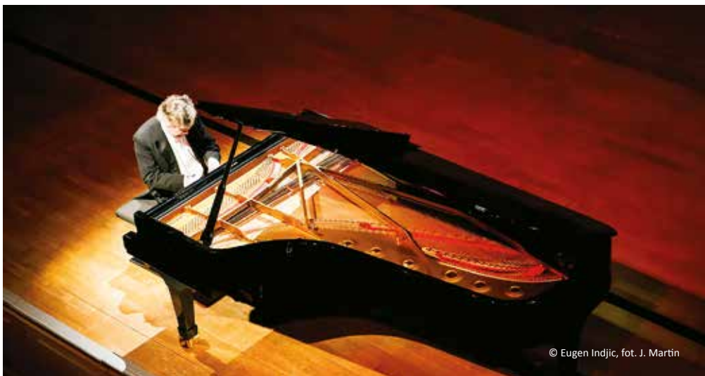
© Eugen Indjic, fot. J. Martin

Na początku lat 70. ubiegłego wieku, poślubiwszy Odile Rabaud, osiadł we Francji, a następnie przyjął, obok amerykańskiego, również francuskie obywatelstwo. Sukcesy w najważniejszych między-