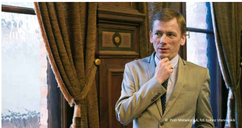
© Piotr Matwiejczuk, fot. Łukasz Ulanowski

Piotr Matwiejczuk Program z Polskiego Radia