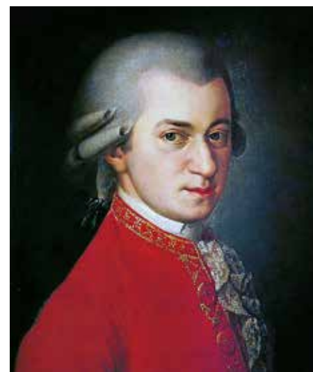
Wolfgang Amadeus Mozart - Barbara Krafft, 1819, Mozart House